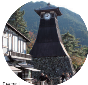
「出石」 最寄りバス停 豊田町(豊岡)バス停 但馬の「小京都」と呼ばれる出石。風情 ある街並みと「出石の皿そば」が有名。