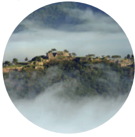
「竹田城跡」 最寄りバス停 和田山ICバス停 しばしばその姿が 雲海に霞んで見える ことから、「天空 の城」や「日本のマ チュピチュ」とも呼 ばれている。