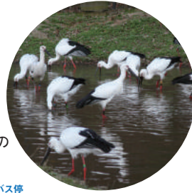
「コウノトリの 郷公園」 最寄りバス停 豊田町(豊岡)バス停 国の特別天然記念物コウノトリの日本最後の生息地となっ た豊岡市。人とコウノトリが共生できる環境づくりを目指して つくられた、県立コウノトリの郷公園はコウノトリの保護・増 殖、野生復帰に取り組む施設であり、園内では間近にコウ ノトリを観察でき、環境学習の場ともなっている。