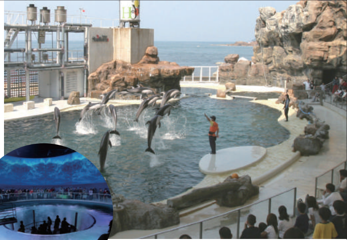
毎年変わるイルカ・アシカショー。 シーランドスタジアムで楽しめるのは、イルカをはじめ アシカやペンギンたちの魅惑のショータイム!

「水族館以上であること」を考え、 毎年テーマを決めたショーが楽しめる城崎マリンワールド。 イルカにタッチしたり、ペンギンと一緒に散歩したり、普通的水族館ではない 「アジ釣り体験」などの思いもよらないアトラクションがいっぱい。