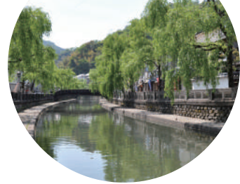
「城崎温泉」 最寄りバス停 城崎温泉駅バス停 志賀直哉をはじめ、多くの文人墨客に愛 された温泉。七つの外湯とゆかたの似合 う町で、木造旅館が立ち並び大瀬川沿 いをそぞろ歩きで楽しんでみては。