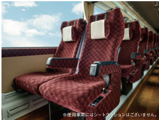
※使用車両にはシートクッションはございません。