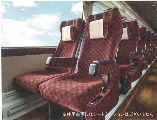
※使用車両にはシートレクレーションはございません。