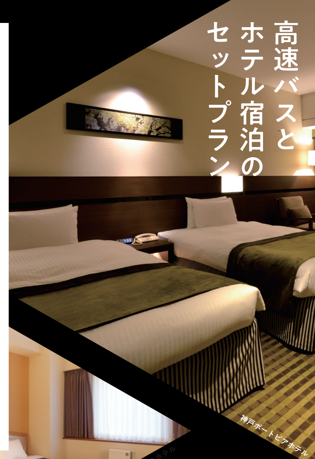
神戸ポートピアホテル